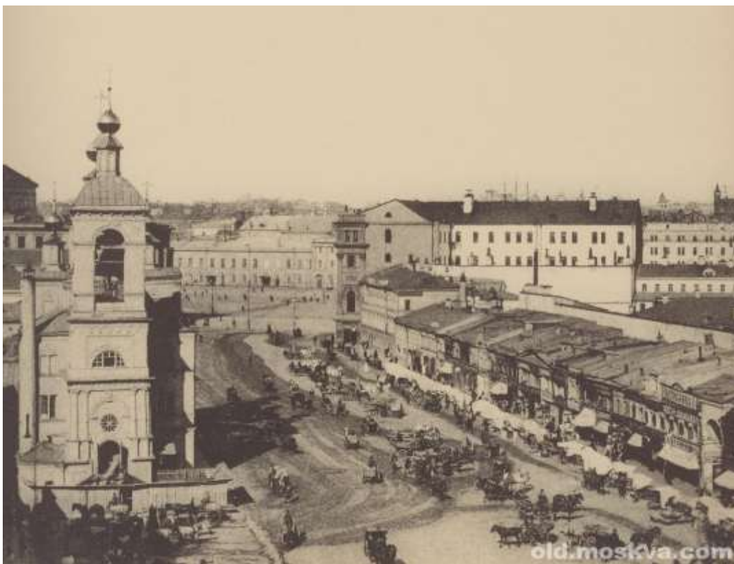
Рисунок 2. Охотный ряд и Манежная площадь в середине 1930-х гг. 11