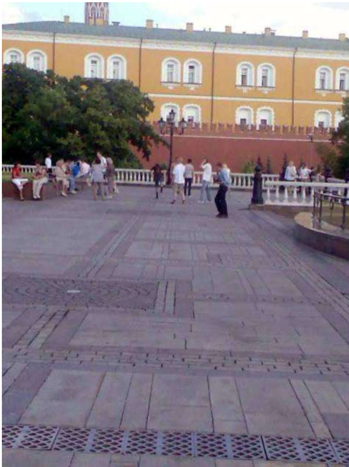
Рисунок 10. Манежная площадь. Центральная часть 29

Люди на площади размещаются в основном там, где есть элементы текстуры: газоны, фонари, скамейки, тумбы. Где ничего нет, они не склонны заполнять пустоту своей активностью, даже если эта активность нуждается в просторе. Материальные артефакты в большей близости от них не только задают возможности для кинестетического синтеза, но и создают более или менее размытую среду смысловых содержаний. На пустой поверхности кровли ОР можно прогуляться, остановиться для разговора, сыграть в сокс. Но основные занятия требуют мест прикрепления деятельности, сочетания активности действующего с осмысленностью артефакта. В отличие от внутренних помещений ОР , на поверхности простор не дает совершиться и принудительному кинестетическому синтезу, так что перемещения здесь связаны не с тем, что людской поток не позволяет остановиться, но с тем, что