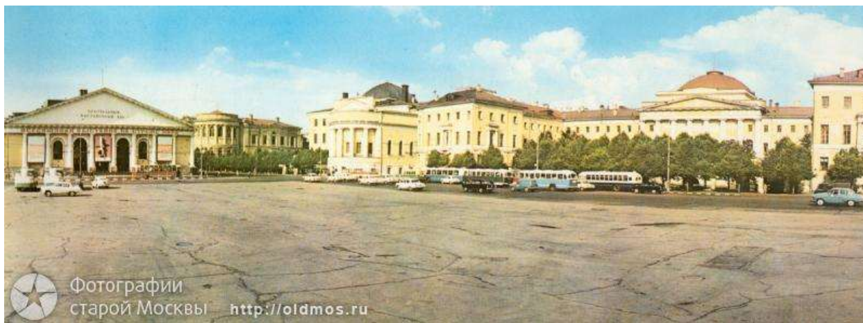
Рисунок 3. Манежная площадь в 1960-е гг. 12

В советские годы площадь заполнялась людьми и военной техникой лишь на время парадов, выступая дополнительным ресурсом Красной площади 13 . Пространство пустоты расширялось и, так сказать, стерилизовалось, становясь все более свободным — от строений, от людей и машин. Судя по всему, это не было результатом реализации единого замысла. По меньшей мере, две основных задачи, решение которых привело к полной расчистке Манежной, не были прямо связаны между собой. Место будущей площади начали серьезно расчищать в связи со строительством метро, но часть жилых зданий сохранилась, их снесли позже, при возведении гостиницы «Москва».