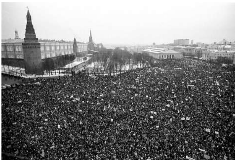
Рисунок 4. Манежная площадь в 1990 г. 14

В первые годы существования Российской Федерации Манежная площадь стала местом публичных акций, митингов и демонстраций, в том числе (и чем дальше, тем чаще) антиправительственных.