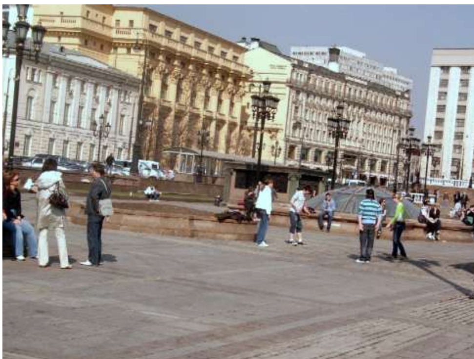
Рисунок 8. Центральный участок Манежной. Игра в сокс 27

На большом участке площади обычно ничего делать , она пустует, как пустовала до реконструкции. Но так обстоят дела не только здесь.