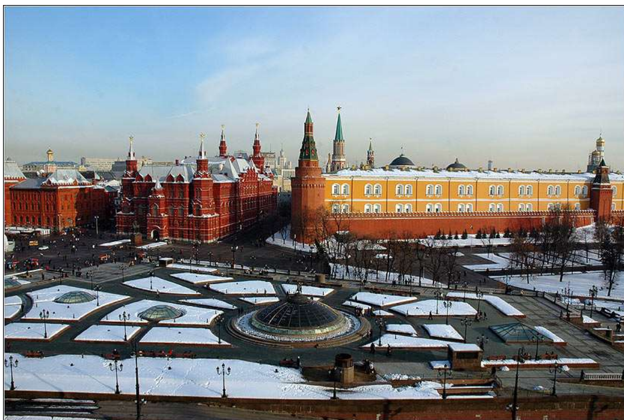
Рисунок 6. Манежная площадь в наши дни 24

Рассказы архитекторов, которые следовало бы анализировать куда более подробно, позволяют даже в кратком, сухом изложении обнаружить определенную идею места . Попробуем