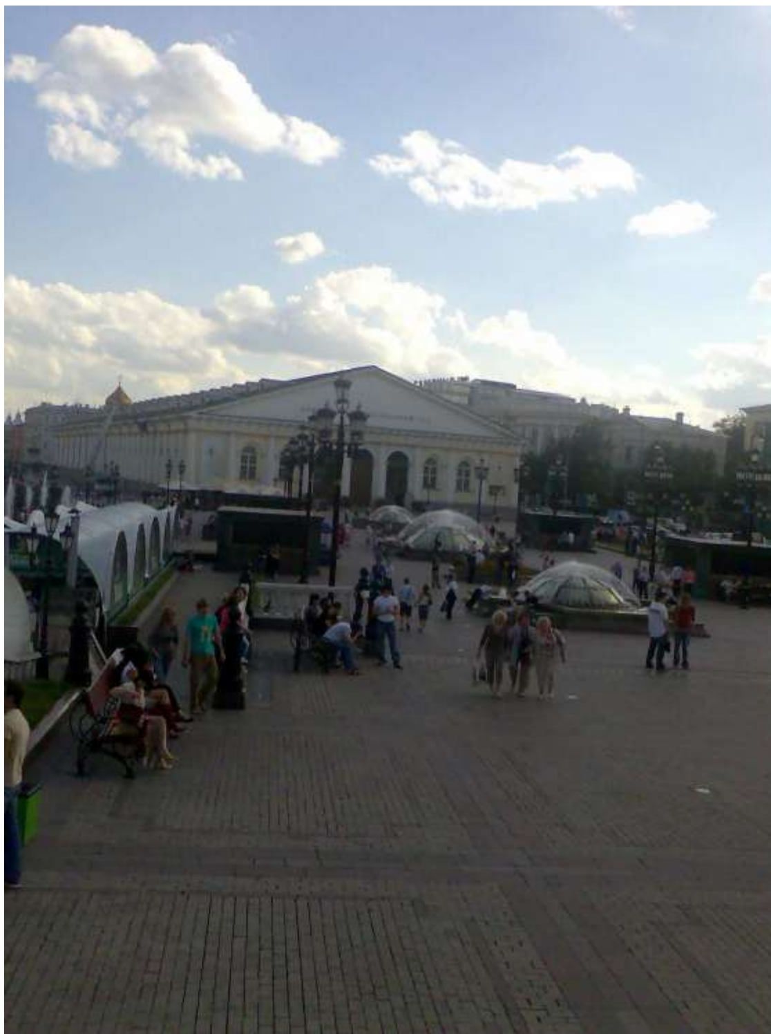
Рисунок 9. Манежная площадь. Центральная часть 28

Гипотетически можно сформулировать это следующим образом: там, где отсутствует минимальная текстура, отсутствует и поведенческая рутина, пустому соответствует ожидание радикального наполнения массой. Незначительной текстурированности соответствуют виды деятельности, оставляющие основную часть пространства пустым. Отчасти это подтверждают сделанные нами наблюдения. Разумеется, многое зависит от времени года и времени суток, Манежная бывает заполнена куда более плотно, чем это приходилось наблюдать нам. Однако в общем и целом она в той части, которая расположена над ОР , выглядит чаще мало заполненной. В чередовании пустого и заполненного есть много случайного и много такого, что определяется отнюдь не социальной конструкцией пространства. Однако одна зависимость буквально бросается в глаза.