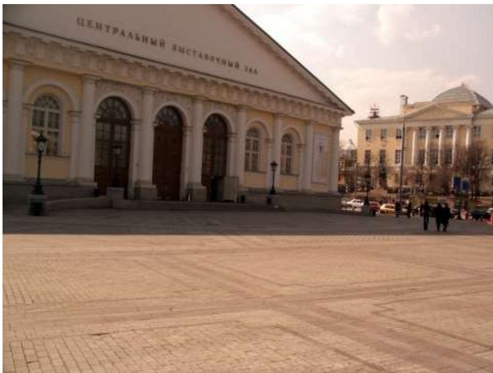
Рисунок 7. Место рядом с Манежем, предполагаемая «Площадь искусств» 26

На большом участке площади обычно ничего делать , она пустует, как пустовала до реконструкции. Но так обстоят дела не только здесь.