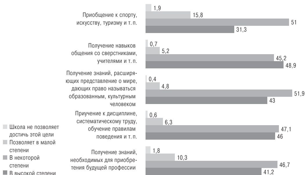
Рис. 3. Степень реализации школой запросов родителей, %

В табл. 1 представлено соотношение ожиданий родителей и их оценки выполнения конкретных задач школами, в которых учатся их дети (табл. 1).