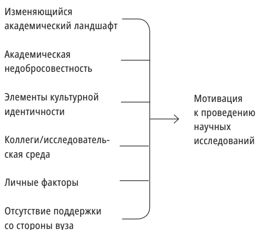
Рис. 2. Факторы, влияющие на исследовательскую продуктивность преподавательского состава

Регрессионный анализ (табл. 2) показывает, что такие факторы, как позиция преподавателя в вузе, возраст вуза, опыт преподавания, размер заработной платы, имеющиеся степени, наличие стремления получить более высокую степень и удаленность ме-