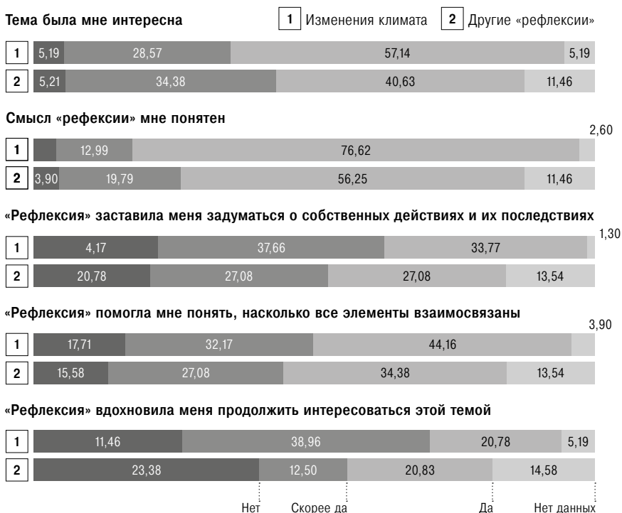
Рис. 1. Сравнение «рефлексии» об изменении климата и других «рефлексий» по некоторым аспектам анкеты (N = 173)

учащихся (42%) отметили, что чувствовали неуверенность при принятии решений. При этом только 18% опрошенных признали, что наличие множества разных точек зрения вызвало у них замешательство и затруднило принятие решения. Что касается системного мышления, большинство учащихся согласилось с утверждением, что через работу с «рефлексиями» они стали лучше понимать, что все элементы окружающей нас среды взаимосвязаны (75%), отметили, что поняли смысл «рефлексии» (90%) и стали осознавать свою ответственность за последствия собственных действий (71%).