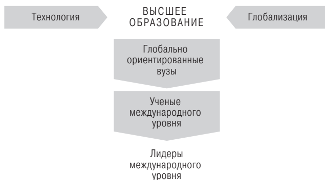
Рис. 1. Важные факторы влияния в сфере высшего образования