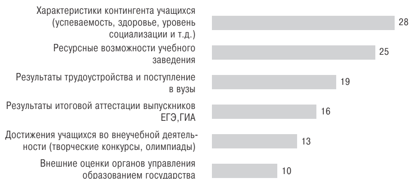
Рис. 5. Распределение мнений руководителей школ относительно критериев эффективности образовательных программ (частота выбора группы)